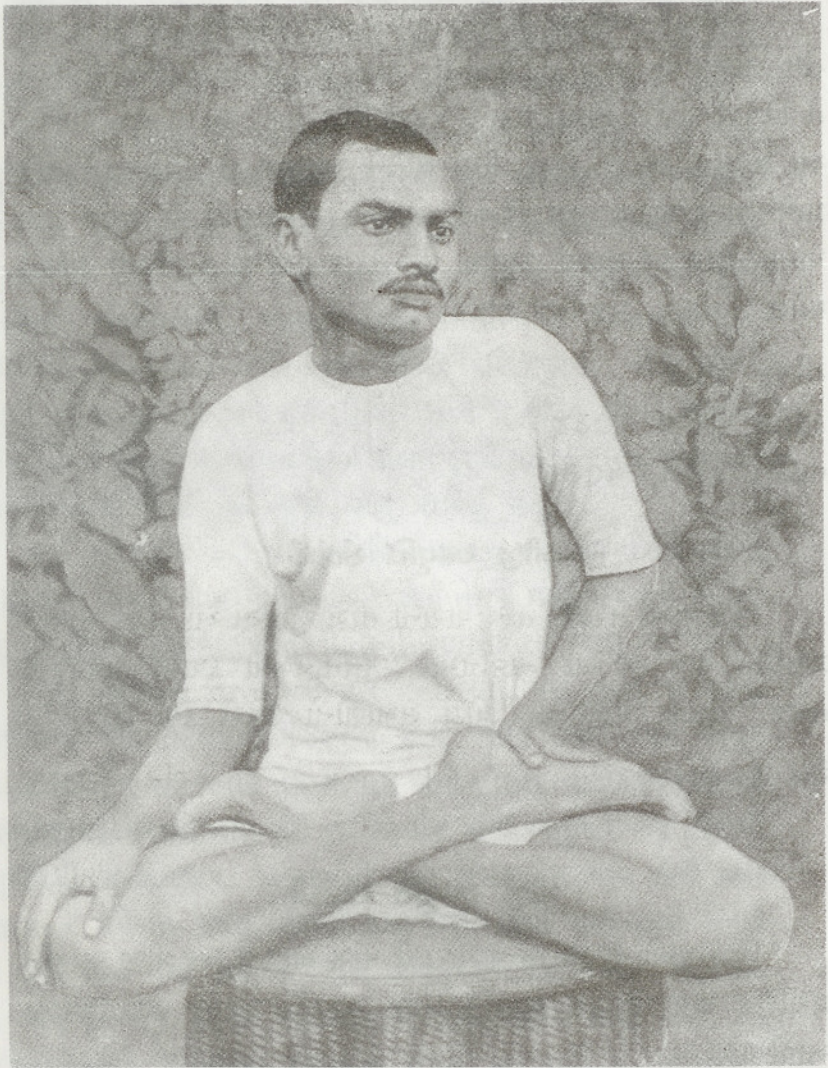
परम कृपालु श्रीमद् राजचंद्र